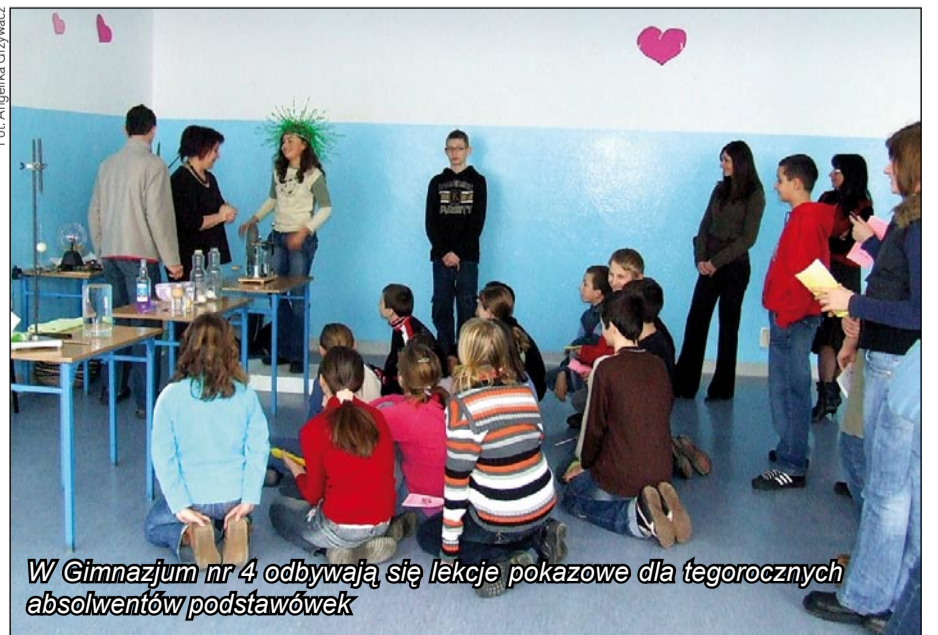
W Gimnazjum nr 4 odbywają się lekcje pokazowe dla tegorocznych absolwentów podstawówek