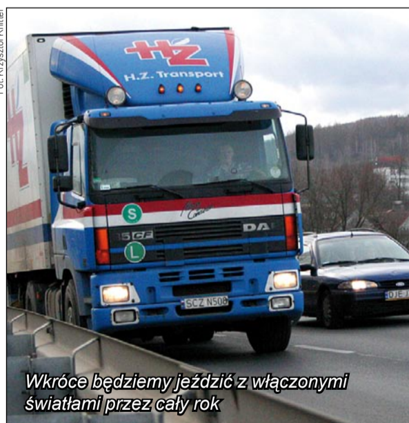
Wkrótce będziemy jeździć z włączonymi światłami przez cały rok