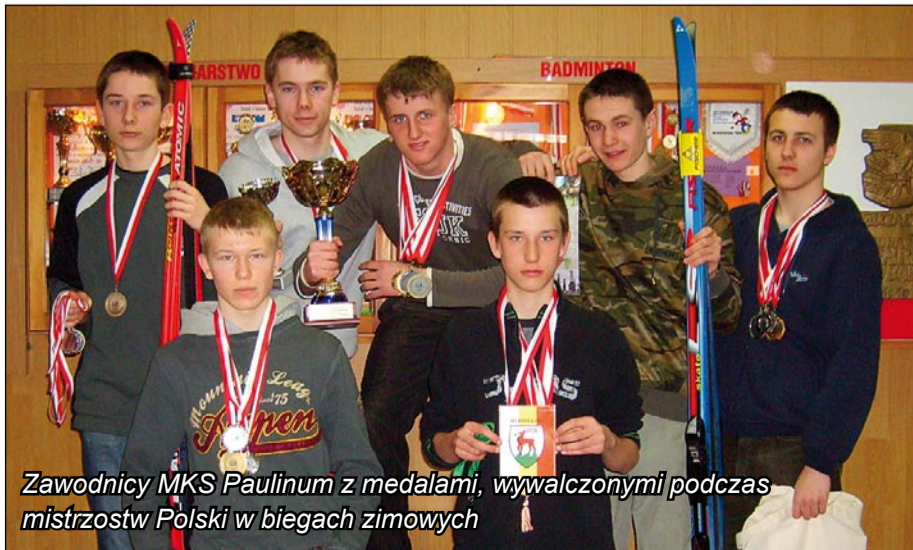
Zawodnicy MKS Paulinum z medalami, wywalczonymi podczas mistrzostw Polski w biegach zimowych