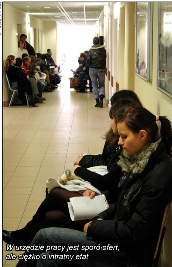
W urzędzie pracy jest sporo ofert, ale ciężko o intratny etat