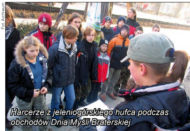
Harcerze z jeleniogórskiego hufca podczas obchodów Dnia Myśli Braterskiej