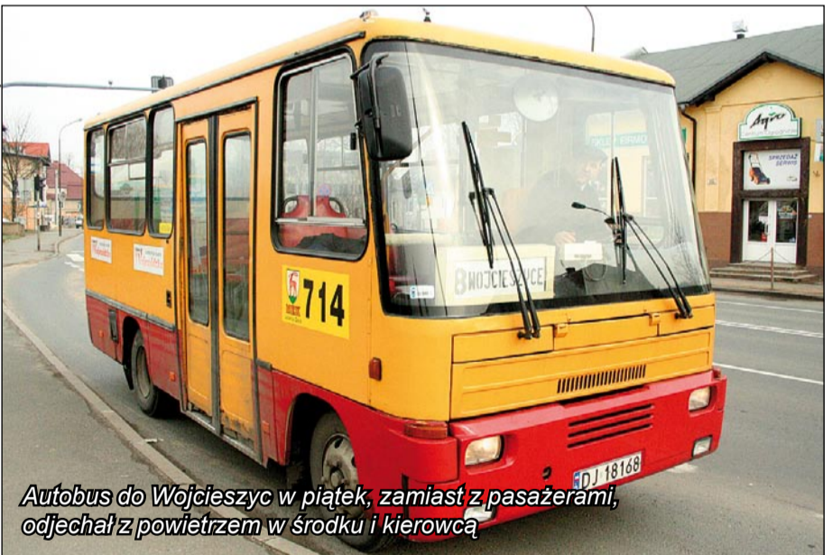
Autobus do Wojcieszyc w piątek, zamiast z pasażerami, odjechał z powietrzem w środku i kierowcą

Krychą można dojechać także do Starej Kamienicy i sąsiedniego Kromnowa. Zainteresowanie spore. Wsparcia samorządu lokalnego nie trzeba.