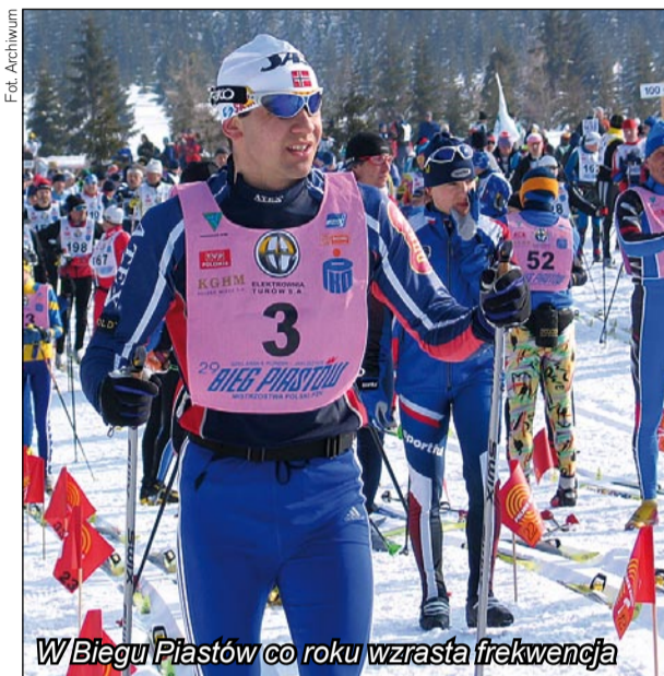
W Biegu Piastów co roku wzrasta frekwencja