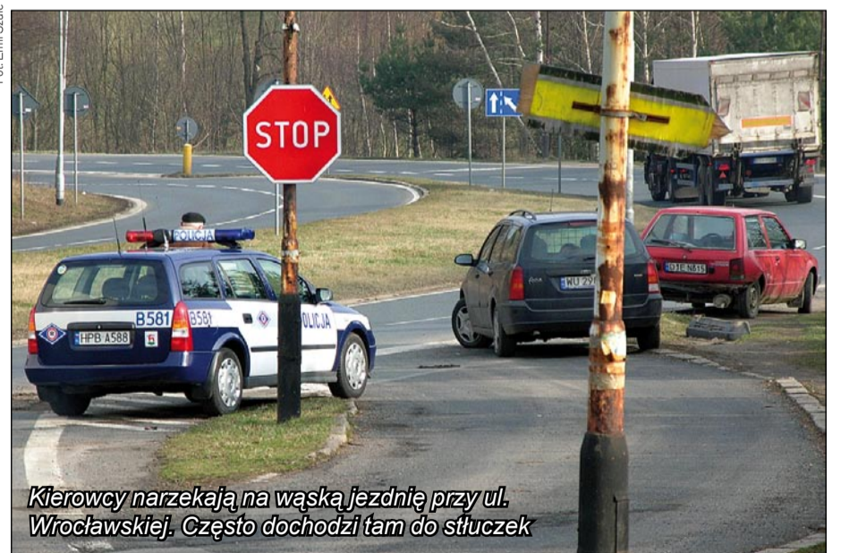
Kierowcy narzekają na wąską jezdnię przy ul. Wrocławskiej. Często dochodzi tam do stłuczek

Kierowcy mają ciągle kłopoty z dostosowaniem się do orga-