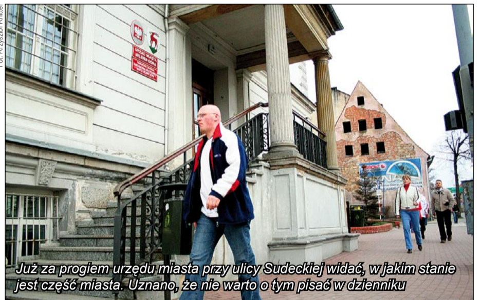
Już za progiem urzędu miasta przy ulicy Sudeckiej widać, w jakim stanie jest część miasta. Uznano, że nie warto o tym pisać w dzienniku