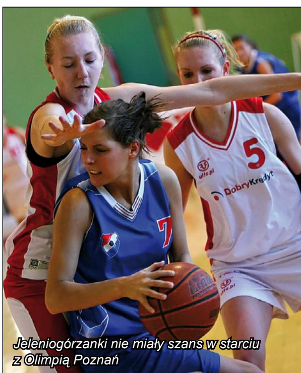
Jeleniogórzanki nie miały szans w starciu z Olimpią Poznań