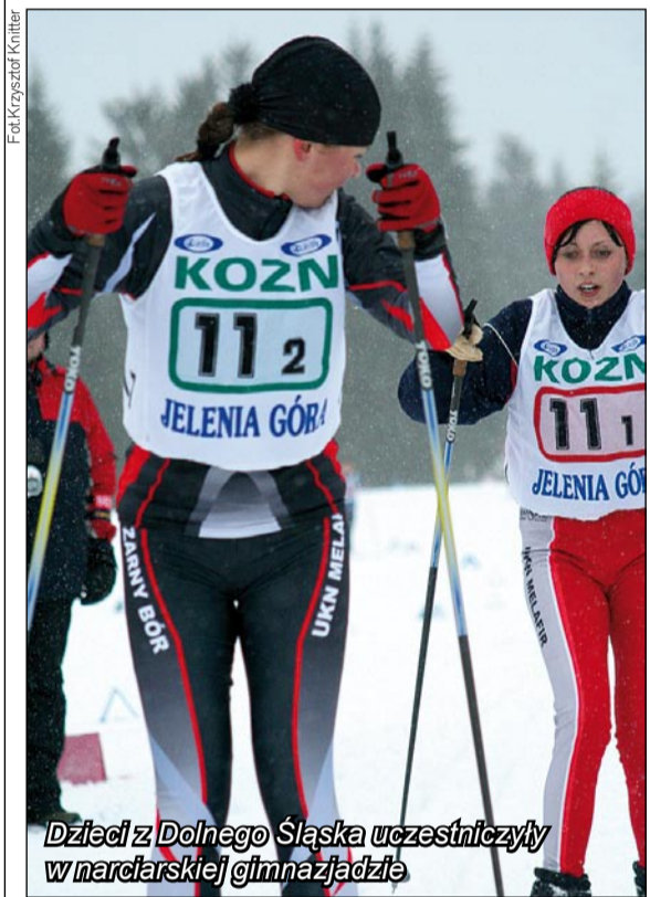
Dzieci z Dolnego Śląska uczestniczyły w narciarskiej gimnazjadzie