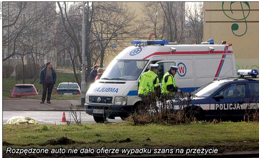
Rozpedzone auto nie dało ofierze wypadku szans na przeżycie

Tymczasem zdaniem sceptyków takie rozwiązania wcale