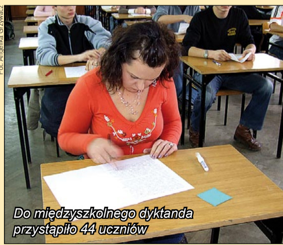
Do międzyszkolnego dyktanda przystąpiło 44 uczniów