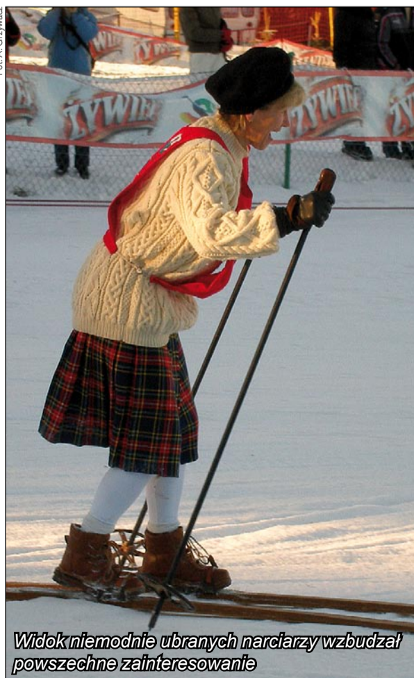
Widok niemodnie ubranych narciarzy wzbudzał powszechne zainteresowanie