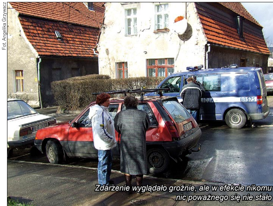
Zdarzenie wyglądało groźnie, ale w efekcie nikomu nic poważnego się nie stało

JELEŃ GÓRA Policjant nie stanie przed sądem