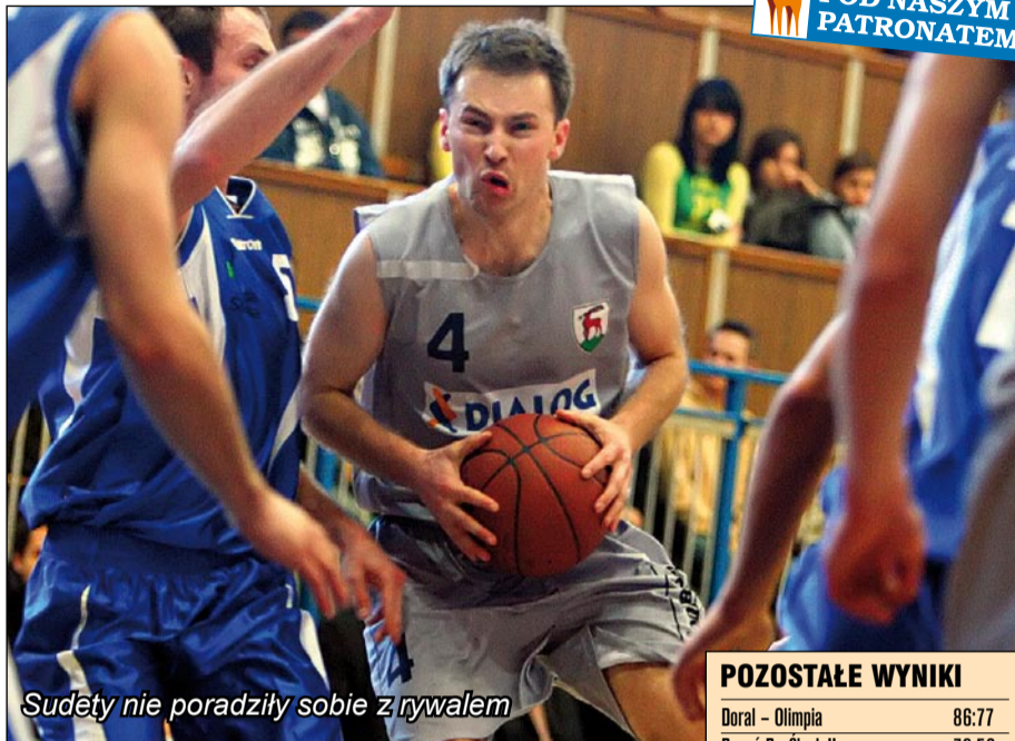
Sudety nie poradziły sobie z rywalem