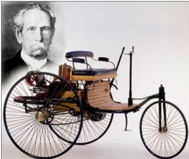
Benz Carl Friedrich - 1885 r. pierwszy pojazd z silnikiem benzynowym

dzając taśmę montażową i masowo produkując model T za niecałe 300$ wypchnął z rynku droższe pojazdy elektryczne. Oferta producentów samochodów elektrycznych skierowana była do ludzi zamożnych, mieszkających w mieście. Wybuch II wojny światowej spowodował zaniechanie prac nad pojazdami elektrycznymi. Nastąpił natomiast gwałtowny rozwój silników spa-