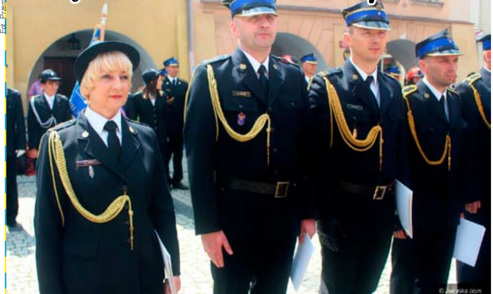
Na Placu Ratuszowym w Jeleniej Górze odbyły się 19 maja oficjalne uroczystości z okazji Dnia Strażaka. Były odznaczenia, awanse oraz przekazanie wozu dla jeleniogórskiej jednostki.