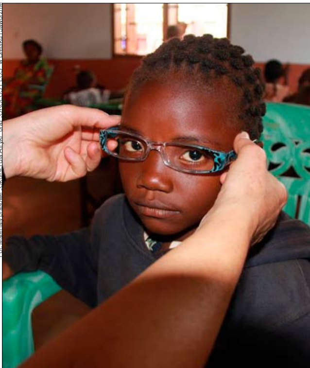
Fot. Materiały prasowe - Okuliści dla Afryki - oraz OKULUS PLUS - w Bielsku-Laworznie