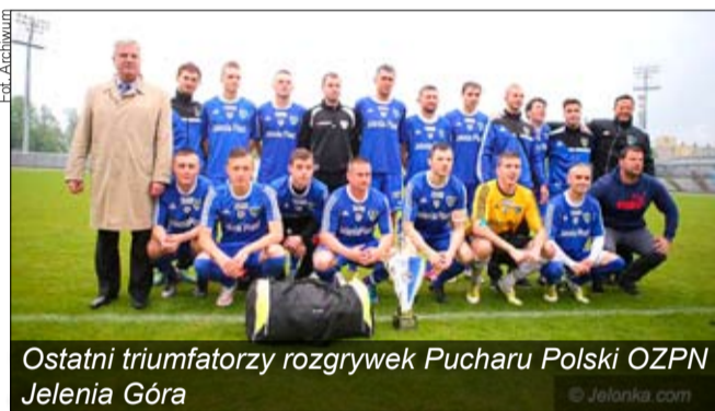
Ostatni triumfatorzy rozgrywek Pucharu Polski OZPN Jelenia Góra