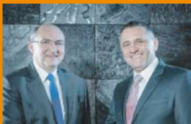
Tomasz Smolarz Wojewoda Dolnośląski