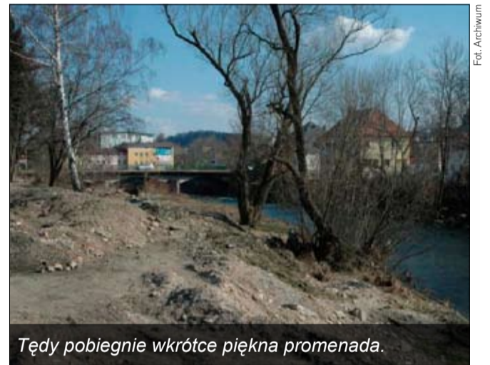
Tędy pobiegnie wkrótce piękna promenada.