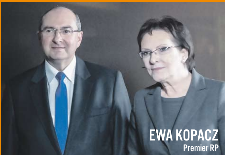
EWA KOPACZ Premier RP

PATRIOTYCZNE WYCHOWANIE I SZACUNEK DO POLSKIEJ HISTORII ORAZ TRADYCJI. NAWET NA WAKACJACH.