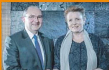
Małgorzata Omilanowska Minister Kultury i Dziedzictwa Narodowego