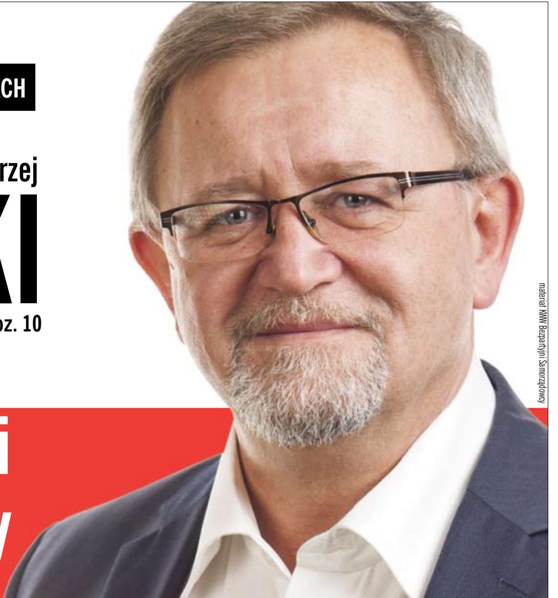
materiał KWW Bezpartyjni Samorządowcy