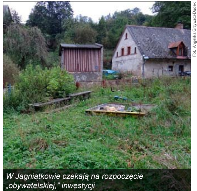
W Jagniątkowie czekają na rozpoczęcie „obywatelskiej” inwestycji

Kolejnym krokiem jest poddanie wniosków głosowaniu, które rozpocznie się 13 października br. i potrwa do 23 października br.