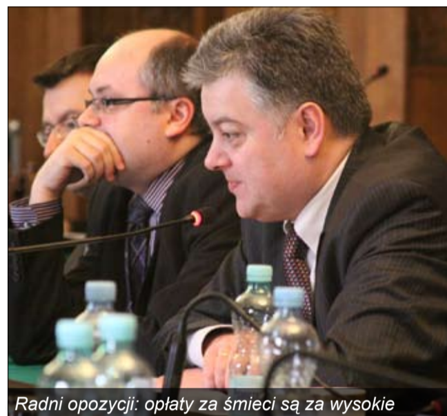
Radni opozycji: opłaty za śmieci są za wysokie