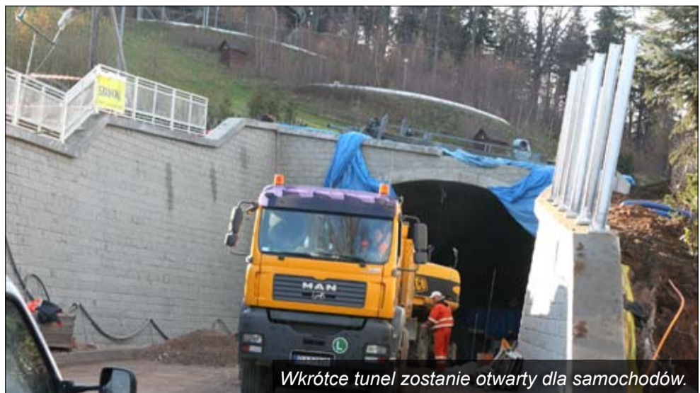
Wkrótce tunel zostanie otwarty dla samochodów.