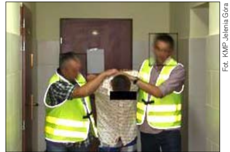
Mieszkaniec Koźuchowa został zatrzymany w Zielonej Górze. Teraz czeka na proces w areszcie.