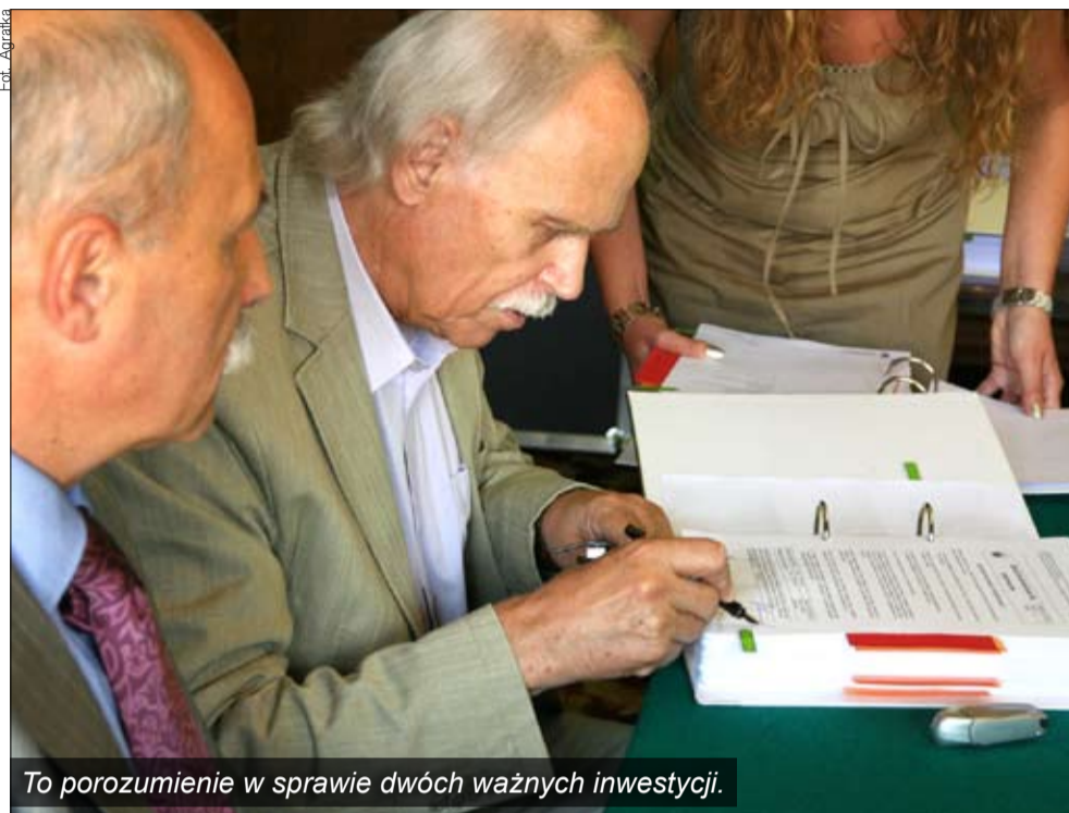
To porozumienie w sprawie dwóch ważnych inwestycji.

Prace rozpoczną się we wrześniu tego roku. Zakończenie inwestycji na Osiedlu Pomorskim i na ul. Warszawskiej planowane jest na sierpień 2013 r. i wyniesie ponad 7 mln zł. Sieć o długości 2,2 km zostanie położona m.in. w obrębie ulic Gdańskiej, Grudziąckiej, Toruńskiej, Bydgoskiej, Tczewskiej, Spółdzielczej