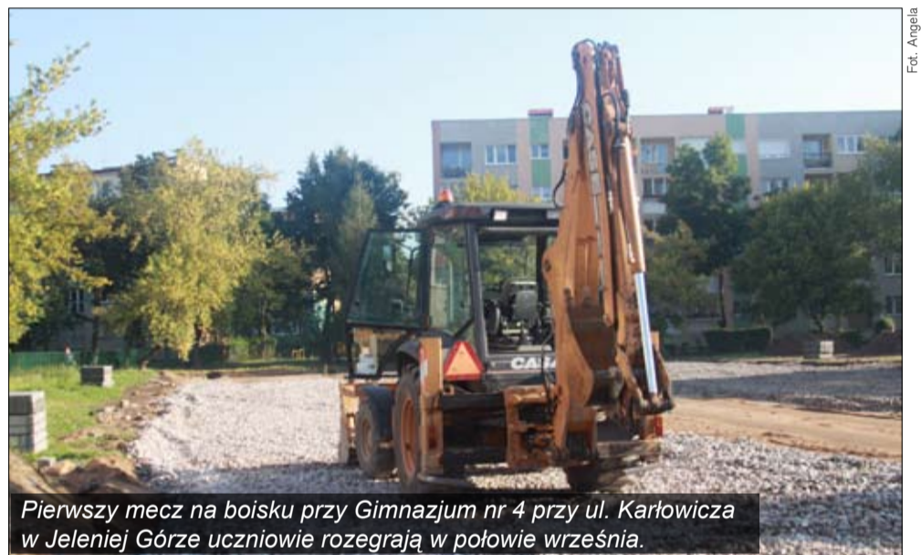
Pierwszy mecz na boisku przy Gimnazjum nr 4 przy ul. Karłowicza w Jeleniej Górze uczniowie rozegrają w połowie września.

- Będą to dwa pełnowymiarowe boiska do piłki siatkowej, jedno boisko do koszykówki. Dodatkowo ma być wybudowany rozbieg do skoku wzwyż. Mam nadzieję, że przy tej inwestycji otrzymamy też elementy do zeskoku. Obecna rzutnia do pchnięcia kulą, którą posiadamy, z racji budowy boisk, zostanie usytuowana w innym miejscu. Po realizacji tej inwestycji będziemy mieli naprawdę pełną bazę sportową. Mamy już boisko do piłki nożnej