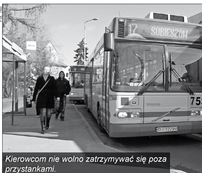
Kierowcom nie wolno zatrzymywać się poza przystankami.

Należy podkreślić, że gdyby kierowca zatrzymał się w miejscu niedozwolonym, a mężczyźnie przy wsiadaniu do autobusu coś by się stało, wtedy kierowca poniósłby w odpowiedzialność za zdarzenie, bo ma ewidentny zakaz zatrzymywania się w miejscach innych, niż zatoczki autobusowe przy przystankach.