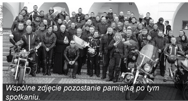
Wspólne zdjęcie pozostanie pamiątką po tym spotkaniu.

W minioną sobotę z placu Ratuszowego w Jeleniej Górze motocykliści z Kotliny Jeleniogórskiej wyruszyli motorową pielgrzymką do Częstochowy, rozpoczynając symbolicznie w ten sposób sezon motocyklowy. - Chcieliśmy pokazać że motocykliści z Jeleniej Góry to osoby, które jeżdżą spokojnie