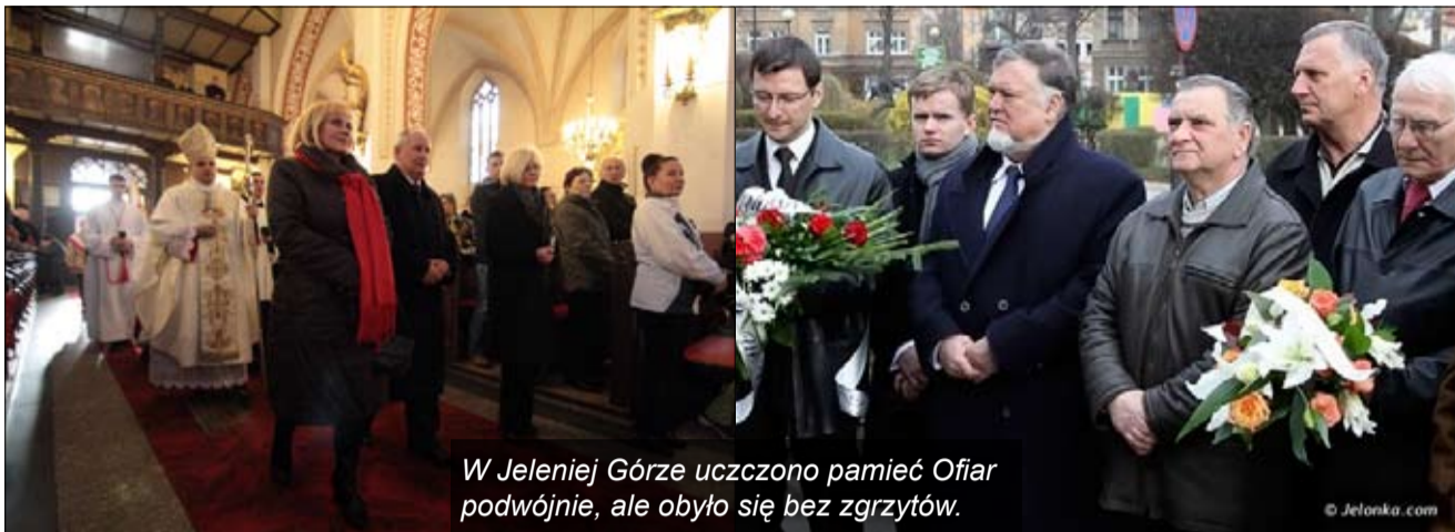
W Jeleniej Górze uczczono pamięć Ofiar podwójnie, ale obyło się bez zgrzytów.