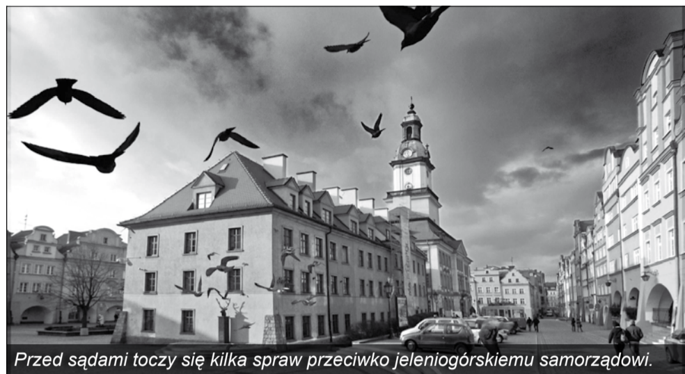
Przed sądami toczy się kilka spraw przeciwko jeleniogórskiemu samorządowi.