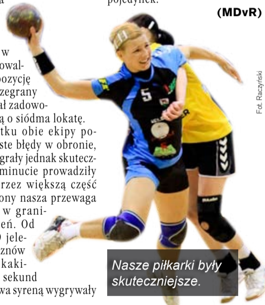
Nasze piłkarki były skuteczniejsze.

KPR Jelenia Góra - KSS Kielce 37:32 (21:17)