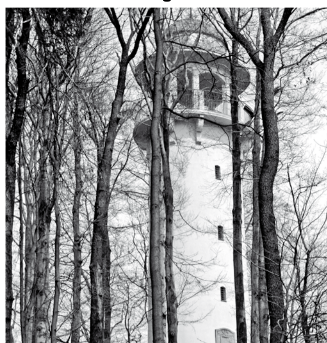
Wieża została odremontowana dzięki wspólnym działaniom z miastem Trutnov (Czechy). Dziś znów wymaga odnowienia.