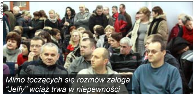
Mimo toczących się rozmów załoga "Jelfy" wciąż trwa w niepewności

W miniony czwartek odbyło się spotkanie zarządu jeleniogórskiej Jelfy z pracownikami na temat sporu zbiorowego oraz restrukturyzacji zatrudnienia pracowników. O obawach przed utratą pracy wyrażonych przez załogę zakładu oraz związkowców pisaliśmy przed tygodniem.