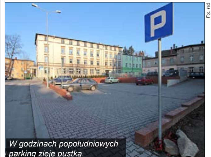
W godzinach popołudniowych parking zije pustką.