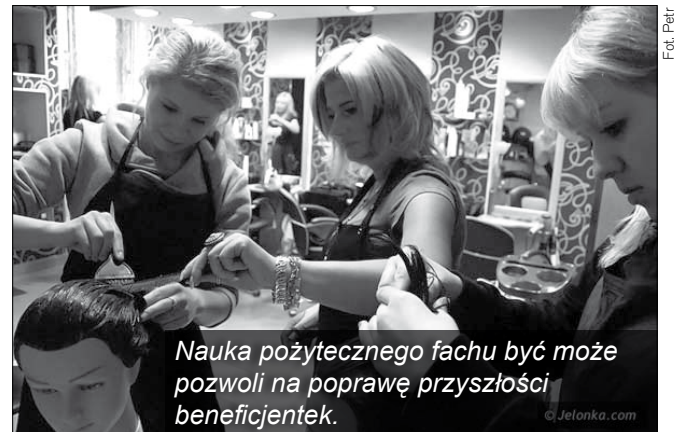
Nauka pożytecznego fachu być może pozwoli na poprawę przyszłości beneficjentek.