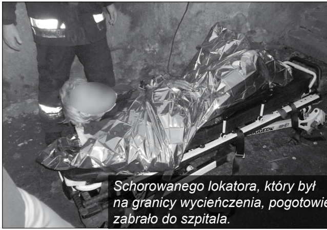
Schorowanego lokatora, który był na granicy wycieńczenia, pogotowie zabrało do szpitala.