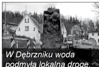
W Dębrzniku woda podmyła lokalną drogę.