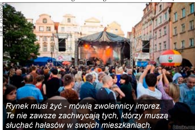
Rynek musi żyć - mówią zwolennicy imprez. Te nie zawsze zachwycają tych, którzy muszą słuchać hałasów w swoich mieszkaniach.

Mieszkańcy placu Ratuszowego wielokrotnie dawali wyraz niezadowoleniu z nocnych hałasów spowodowanych różnymi imprezami. Kilka lat temu sprawa o zakłócenie ciszy nocnej znalazła nawet swój finał w sądzie.