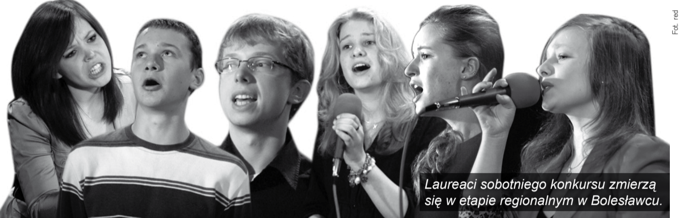
Laureaci sobotniego konkursu zmierzają się w etapie regionalnym w Bolesławcu.