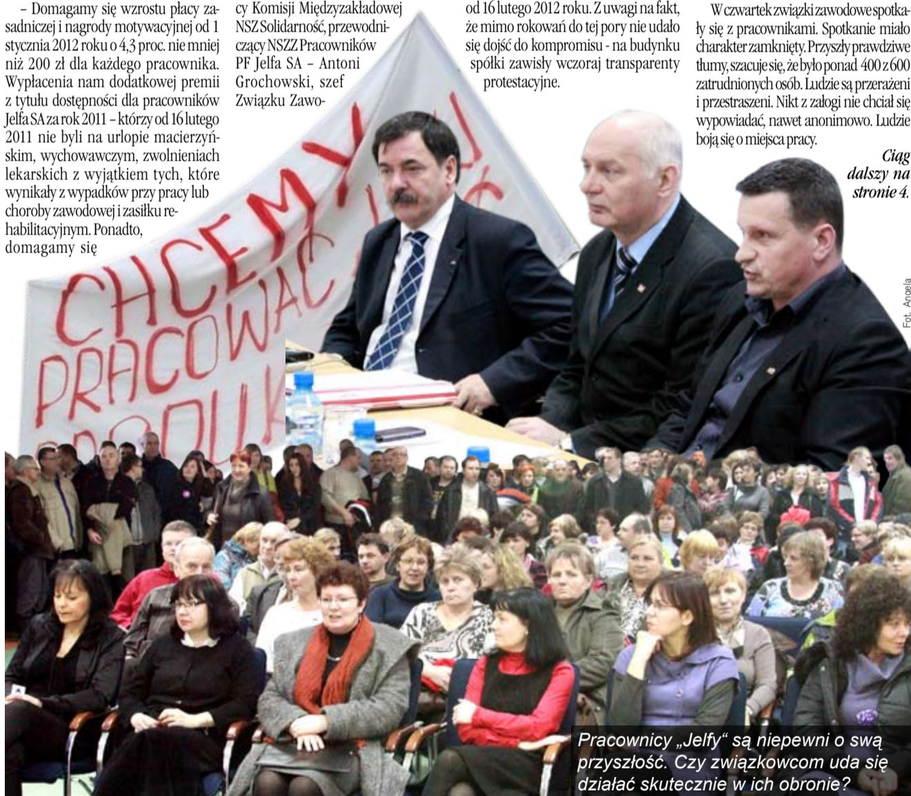
Pracownicy „Jelfy” są niepewni o swą przyszłość. Czy związkowcom uda się działać skutecznie w ich obronie?