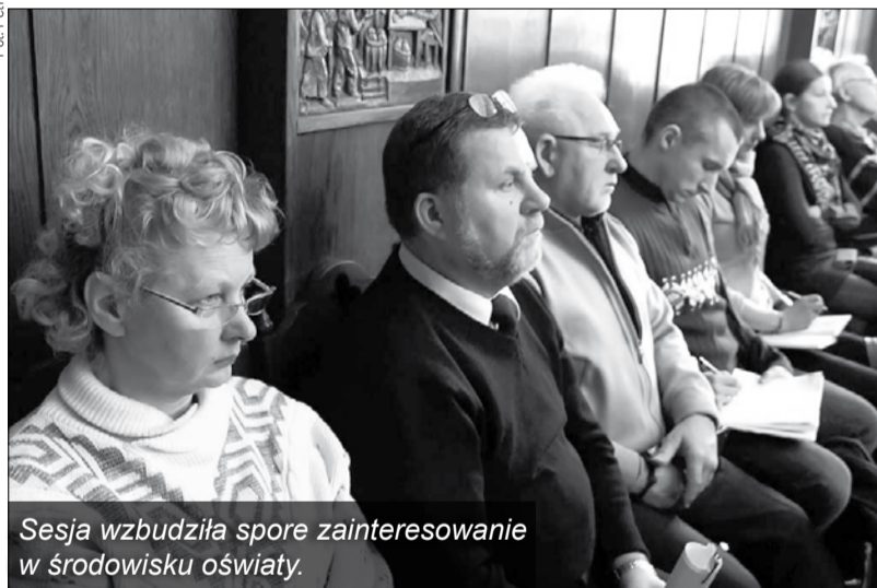
Sesja wzbudziła spore zainteresowanie w środowisku oświaty.