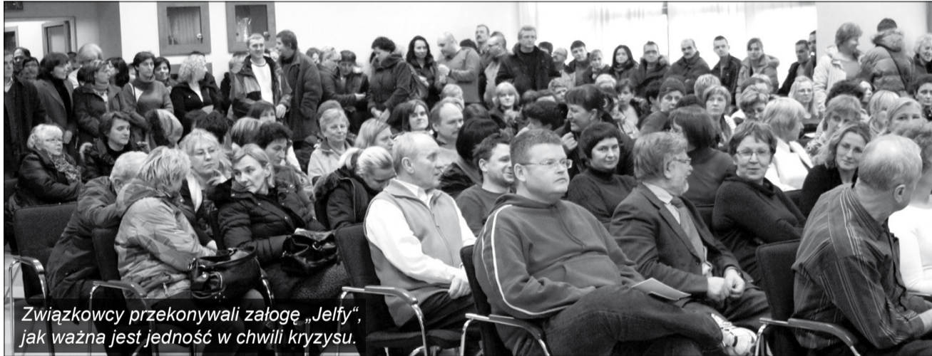
Związkowcy przekonywali załogę „Jelfy”, jak ważna jest jedność w chwili kryzysu.