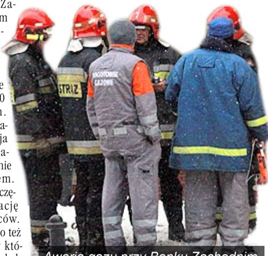
Awaryjne gazu przy Banku Zachodnim.