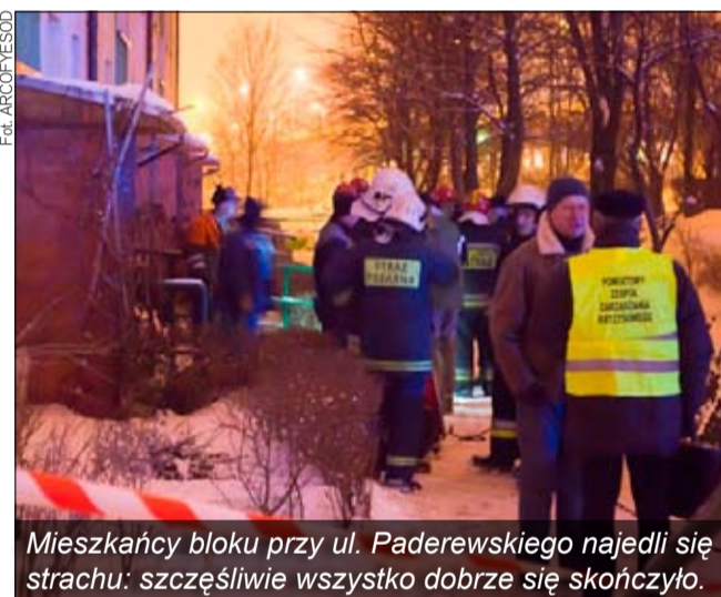
Mieszkańcy bloku przy ul. Paderewskiego najedli się strachu: szczęśliwie wszystko dobrze się skończyło.