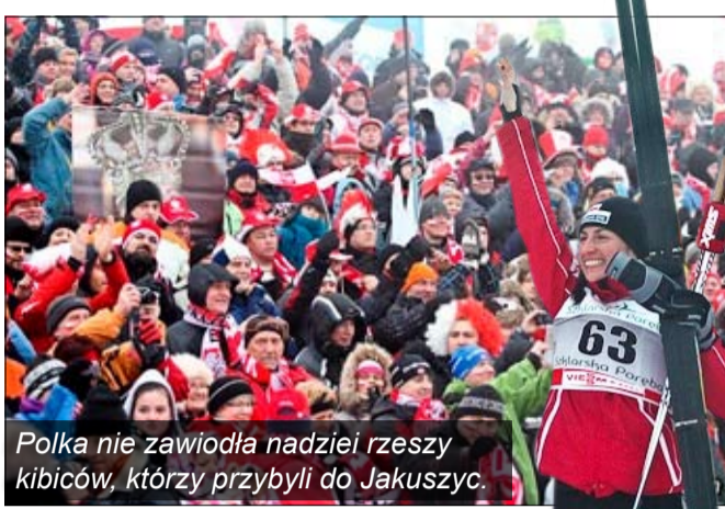
Polka nie zawiodła nadziei rzeszy kibiców, którzy przybyli do Jakuszyckiej.

- Czekałam na to wiele lat i w końcu się doczekałam. To były dla mnie dwa dni wielkiego święta. Te zawody, to największa nagroda,