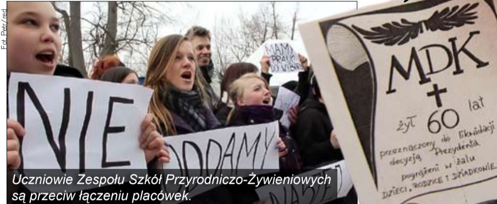
Uczniowie Zespołu Szkół Przyrodniczo-Żywnościowych są przeciw łączeniu placówek.

Pomysł powstał po dokładnej analizie kondycji oświaty w Jeleniej Górze i - jak twierdzą samorządowcy - jest koniecznością. Miejską edukację czeka bowiem niż demograficzna oraz mniejsza subwencja otrzymywana z budżetu centralnego. Biorąc pod uwagę polityczny rozkład sił w radzie miejskiej