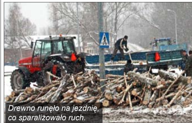
Drewno runęło na jezdnię, co sparaliżowało ruch.