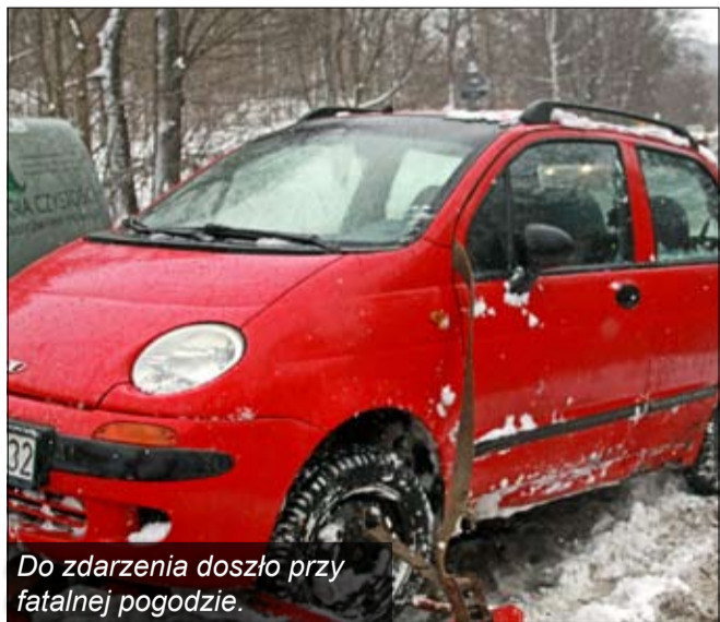
Do zdarzenia doszło przy fatalnej pogodzie.