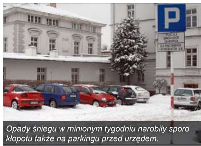
Opady śniegu w minionym tygodniu narobiły sporo kłopotu także na parkingu przed urzędem.