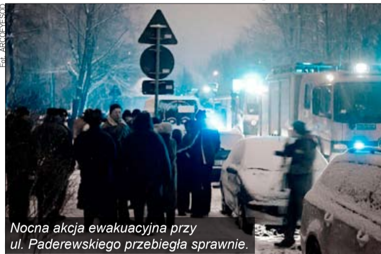
Nocna akcja ewakuacyjna przy ul. Paderewskiego przebiegła sprawnie.

Siarczyste mrozy na przełomie stycznia i lutego połączone z brakiem pokrywy śnieżnej mocno nadwyrężyły sieć miejskiego gazociągu. Skutek? Wybuch i poważne awaryjne wymagające ewakuacji mieszkańców. Czy można spodziewać się wymiany rur, przez które płynie gaz?