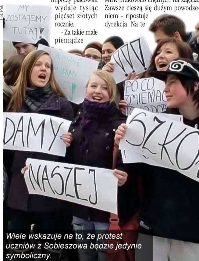
Wiele wskazuje na to, że protest uczniów z Sobieszowa będzie jedynie symboliczny.