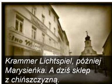
Krammer Lichtspiel, później Marysieńka. A dziś sklep z chińszczyzną.

W programie pierwszej edycji tego wydarzenia znalazły się następujące