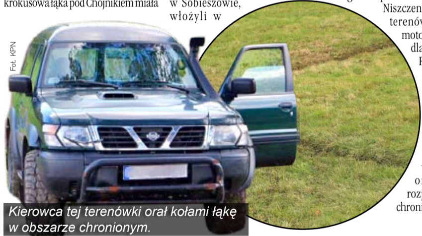
Kierowca tej terenówki orał kołami łąkę w obszarze chronionym.