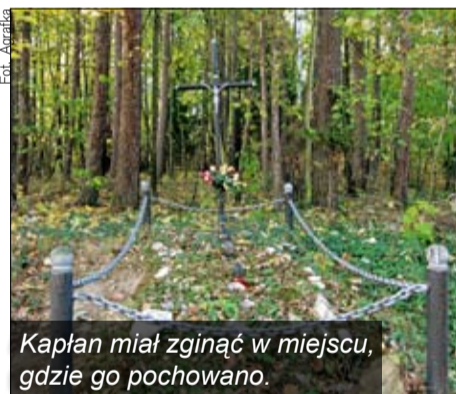
Kapłan miał zginąć w miejscu, gdzie go pochowano.

Nie wiadomo, czy był to ksiądz katolicki, czy ewangelicki, czy był Polakiem, czy Niemcem, a nawet kiedy zmarł, gdyż na grobie brakuje tabliczki. Mogiła jest jednak bardzo zadbana, a pamiętający o niej zawsze zapalają tam znicze.