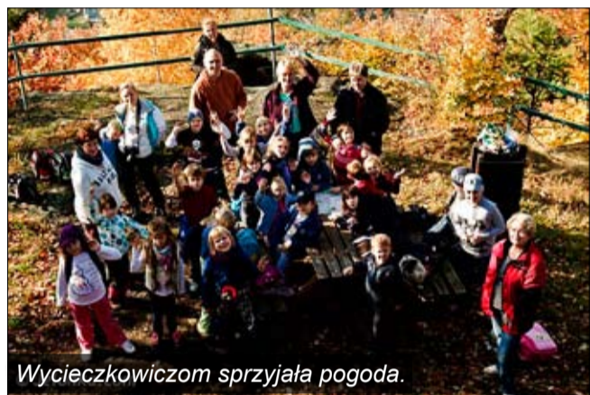
Wycieczkowiczom sprzyjała pogoda.

Szczyt Witoszy, jaskinie i inne zakątki okolic Stanisłowa zwiedzili w ostatnią sobotę października młodzi wycieczkowicze z Klubu Wędrowca działającego przy Szkole 707 w Karpa-