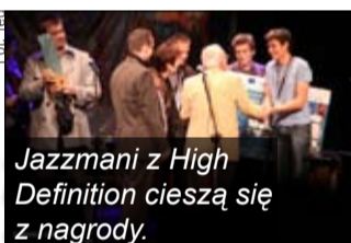
Jazzmani z High Definition cieszą się z nagrody.

Finałowe akordy imprez zabrzmiały w przedostatnią niedzielę