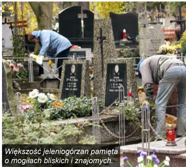
Większość jeleniogórczan pamięta o mogiłach bliskich i znajomych.

Na cmentarzach w mieście i okolicach trwają porządki przed wtorkowym dniem Wszystkich Świętych i Zaduszkami. Korzystniej dla pasażerów odwiedzających nekropole kursują autobusy miejskie. Zabiorze z nowym cmentarzem przy ulicy Sudeckiej połączy we wtorek linia specjalna. Wyznaczono też miejsca parkingowe, a od poniedziałku zaczną obowiązywać tymczasowe zmiany w organizacji ruchu. Nie będzie można zatrzymywać się i parkować wzdłuż ulicy Sudeckiej a odcinek ulicy Jagiellońskiej przy cmentarzu w Cieplicach będzie