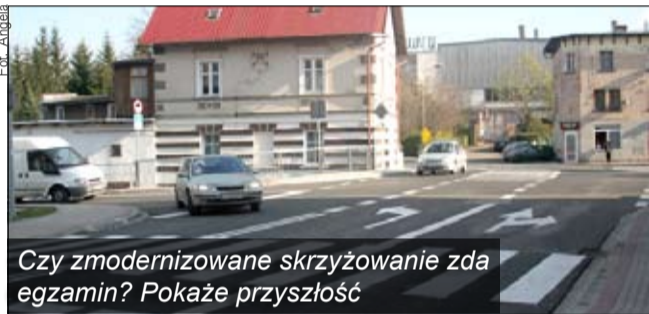
Czy zmodernizowane skrzyżowanie zda egzamin? Pokaże przyszłość

Pół roku trwała przebudowa skrzyżowania ulicy Karkonoskiej z Jeleniogórką. Na tę inwestycję mieszkańcy czekali kilka lat. Biegnie tu bowiem ruchliwa droga wojewódzka 366 Wałbrzych - Karpacz. - Koszty gminy Kowary szacuje się na 100 tys. zł. Samorząd województwa sfinansował przebudowę skrzyżowania z odwodnieniem terenu, wymianę kanalizacji i doprowadzenie sieci wodociągowej, przekazując niemal 1,2 mln zł - poinformował burmistrz Mirosław Górecki. W piątkowym otwarciu