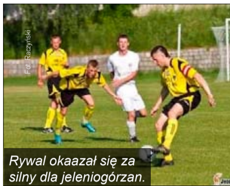
Rywal okazał się za silny dla jeleniogórzan.

Granica Bogatynia - Karkonosze Jelenia Góra 2:1 (2:0)