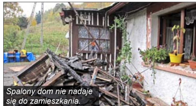
Spalony dom nie nadaje się do zamieszkania.