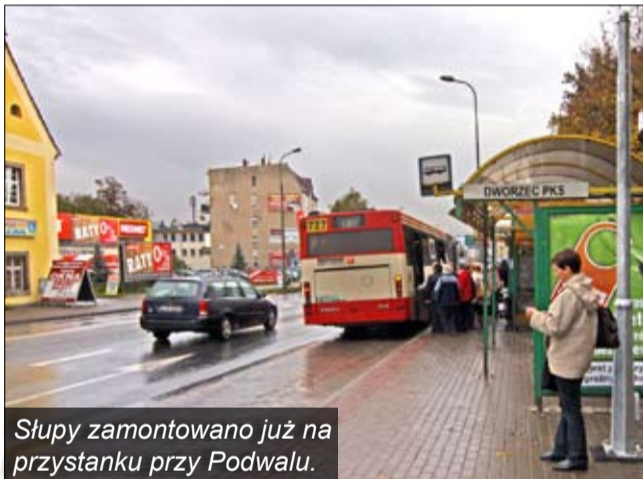
Słupy zamontowano już na przystanku przy Podwalu.