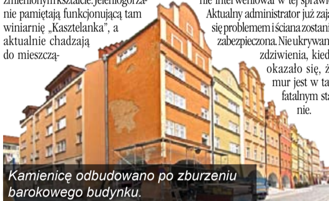
Kamienicę odbudowano po zburzeniu barokowego budynku.

Stan budynku budzi niepokój lokatorów, a o pęknięciach, jakie pojawiły się na ścianach, mieszkańcy informowali wcześniej poprzedniego zarządcę, jednak nikt nie interweniował w tej sprawie. Aktualny administrator już zajął się problemem i ściana zostanie zabezpieczona. Nieukrywane zdziwienie, kiedy okazało się, że mur jest w tak fatalnym stanie.