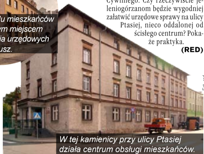
W tej kamienicy przy ulicy Ptasiej działa centrum obsługi mieszkańców.