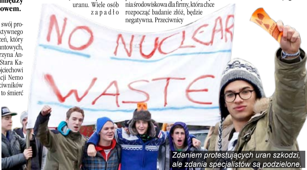
Zdaniem protestujących uran szkodzi, ale zdania specjalistów są podzielone.