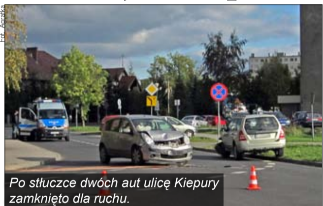
Po stłuczce dwóch aut ulicę Kiepurę zamknięto dla ruchu.

W miniony piątek po południu przy ul. Kiepurę na jeleniogórskim Zabobrze nieopodal pętli autobusowej doszło do zderzenia dwóch aut. Prowadząca nissana jechała nieostrożnie i wymusiła pierwszeństwo na kierującej pojazdem marki Subaru, w wyniku czego doszło do zderzenia czołowego. Kierujące panie były trzeźwe. Do