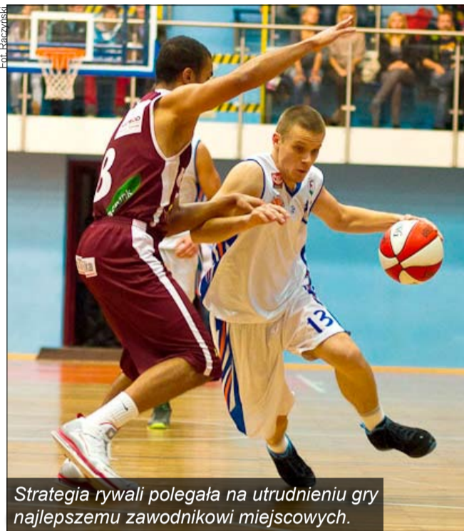
Strategia rywali polegała na utrudnieniu gry najlepszemu zawodnikowi miejscowych.

Sudety Jelenia Góra - Spójnia Stargard Szczeciński 54:71 (18:14, 14:20, 12:20, 10:17) Sudety: Hajnisz (13), Niesobski (11), Wilusz (10), Bukowiecki (7), Wojciul (5), Maryniowski (2), Budziński (2), Kijanowski (2), Minciel (2), Kołtun, Kozak Spójnia: Ochońko (14), Przych (13), Kalinowski (13), Grudziński (10), Stępień (8), Borych (5), Pabian (3), Ulchurski (3), Wójcik (2), Soczewski