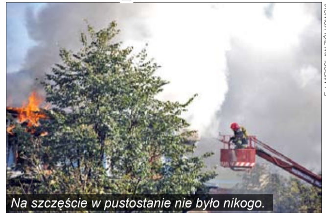
Na szczęście w pustostanie nie było nikogo.

W minioną sobotę po południu wybuchł pożar w pustostanie przy ul. Pijarskiej. Zarzewie ognia udało się szybko zlokalizować i opanować żywioł. - Spłonął cały dach budynku. Przyczyna pożaru nie jest znana, natomiast wiadomo, że w obiekcie nie znajdowali się ludzie. W akcji brało