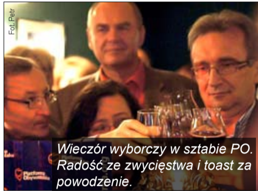
Wieczór wyborczy w sztabie PO. Radość ze zwycięstwa i toast za powodzenie.