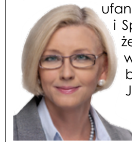
Marzena Machałek poseł na Sejm RP

Serdecznie dziękuję wszystkim wyborcom z okręgu 1, którzy w wyborach parlamentarnych oddali na mnie swój głos, obdarzając zaufaniem moją osobę oraz Prawo i Sprawiedliwość. Zapewniam, że z całym siłą będę pracować w nowym Parlamencie dla dobra naszej Ojczyzny i Regionu Jeleniogórskiego.