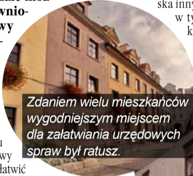
Zdaniem wielu mieszkańców wygodniejszym miejscem dla załatwiania urzędowych spraw był ratusz.