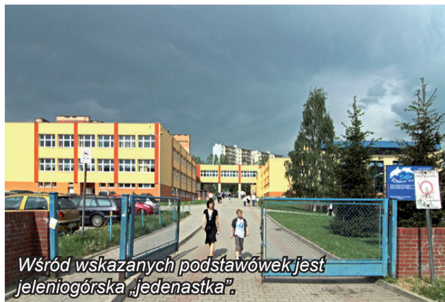
Wśród wskazanych podstawówek jest jeleniogórska „jedenastka”.

finansowe na zakup pomocy dydaktycznych do miejsc zabaw w szkole oraz na zorganizowanie szkolnych placów zabaw.