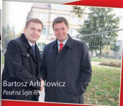
Bartosz Artukowicz Poseł na Sejm RP