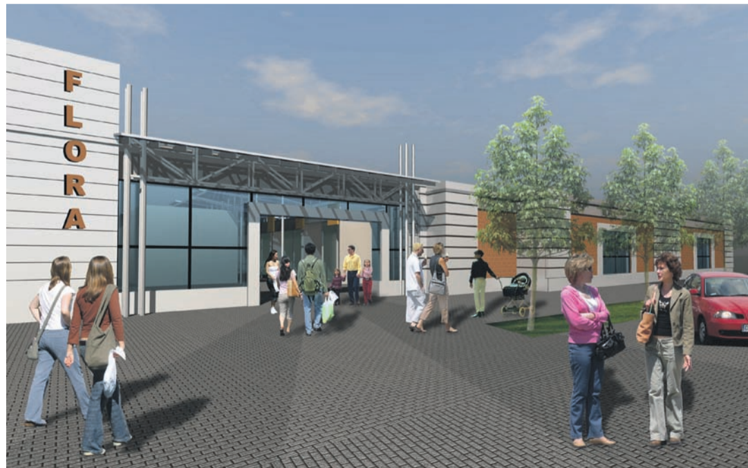
Wejście główne z ulicy Chrobrego