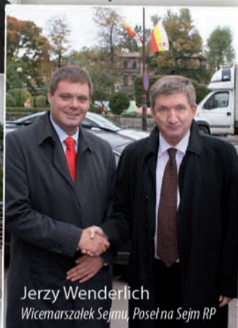
Jerzy Wenderlich Wicemarszałek Sejmu, Poseł na Sejm RP