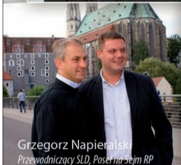
Grzegorz Napieralski Przewodniczący SLD, Poseł na Sejm RP