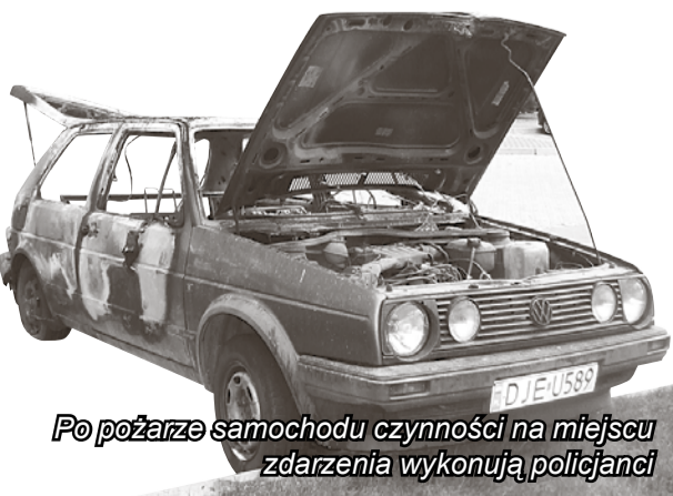
Po pożarze samochodu czynności na miejscu zdarzenia wykonują policjanci