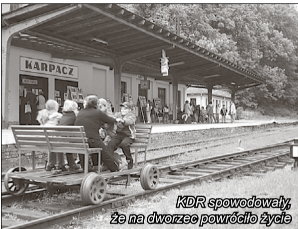
KDR spowodowały, że na dworzec powróciło życie

Niestety, w tym roku pojawiło się zagrożenie dla kontynuowania tej turystycznej atrakcji w kurorcie pod Śnieżką, bo właściciel - Polskie Linie Kolejowe, podlegające PKP S.A., postanowił sprzedać posesję dworca PKP w Karpaczu. Pierwszy przetarg, który miał się odbyć 22 lutego br. został odwołany w wyniku interwencji przedstawicieli KDR, którzy powiadomili ministerstwa transportu o tym, że miasto stara się o przejęcie budynku dworca PKP celem umieszczenia tam ośrodka kultury z muzeum zabawek włącznie. Jednak władze Karpacza zrezygnowały z tego zamiaru, bo wliczyły, że remont zaniedbanego obiektu kosztowałby drogo - około 4 mln zł. - To zbyt wygórowana kwota. Dowiedzieliśmy się w