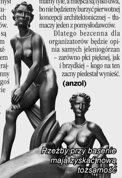
Rzeźby przy basenie mają zyskać nową tożsamość