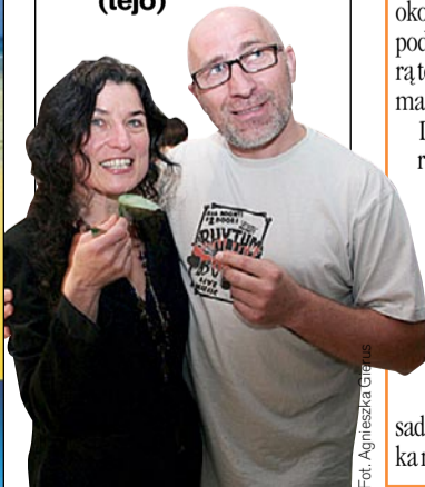
Fot. Agnieszka Gierus