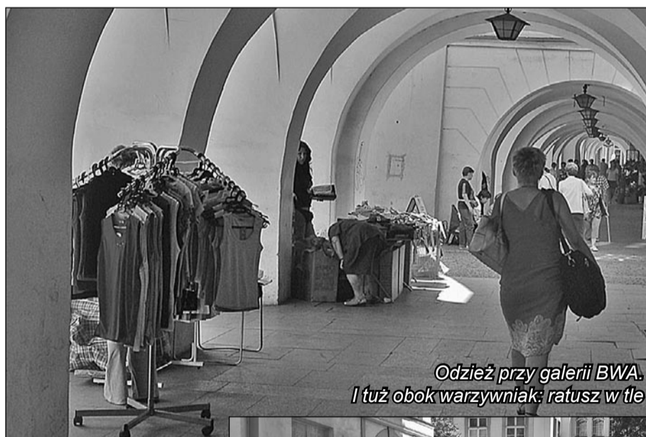
Odzież przy galerii BWA. I tuż obok warzywniak: ratusz w tle

Nawet w Brukseli, której z Jelenią Górą nie ma sensu porównywać, jeden z najpiękniejszych i najbardziej okazałych rynków, także jest miejscem handlu. Tyle że dla turystów. Są tam eleganckie kramiki z pamiątkami i pocztówkami, ale nikomu nawet przez myśl nie przejdzie, aby na Grand Place sprzedawać, za przeproszeniem, gacie, skarpety i koszulki oraz handlować grzybami.