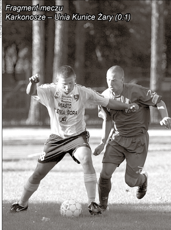
Fragment meczu Karkonosze - Unia Kunice Żary (0:1)

Kluby sportowe oraz organizatorów imprez sportowych, zainteresowanych umieszczeniem zapowiedzi w kalendarium, prosimy o kontakt z redakcją: jelonka@jelonka.com