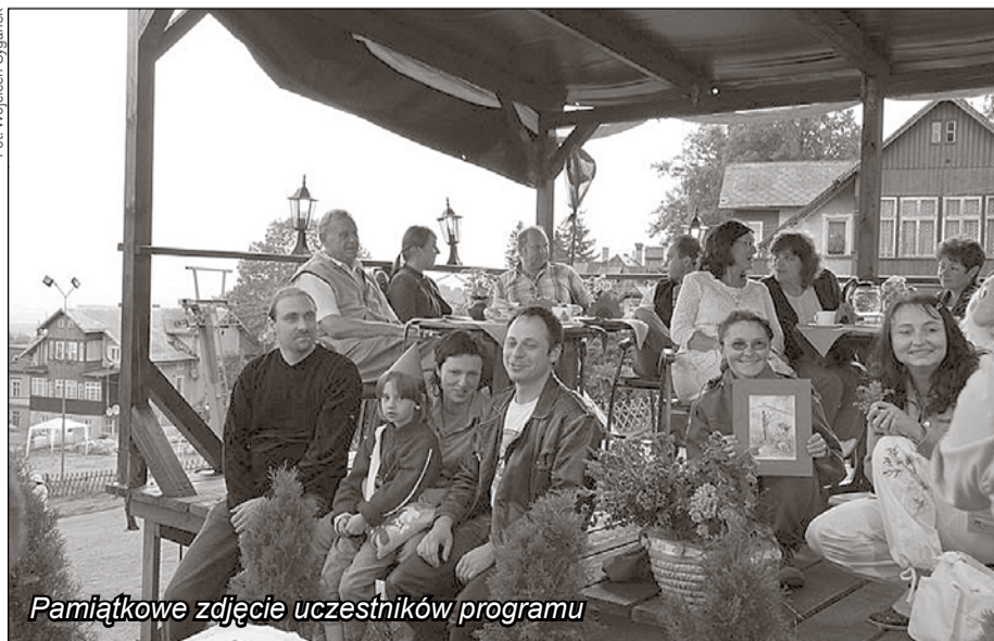
Pamiątkowe zdjęcie uczestników programu