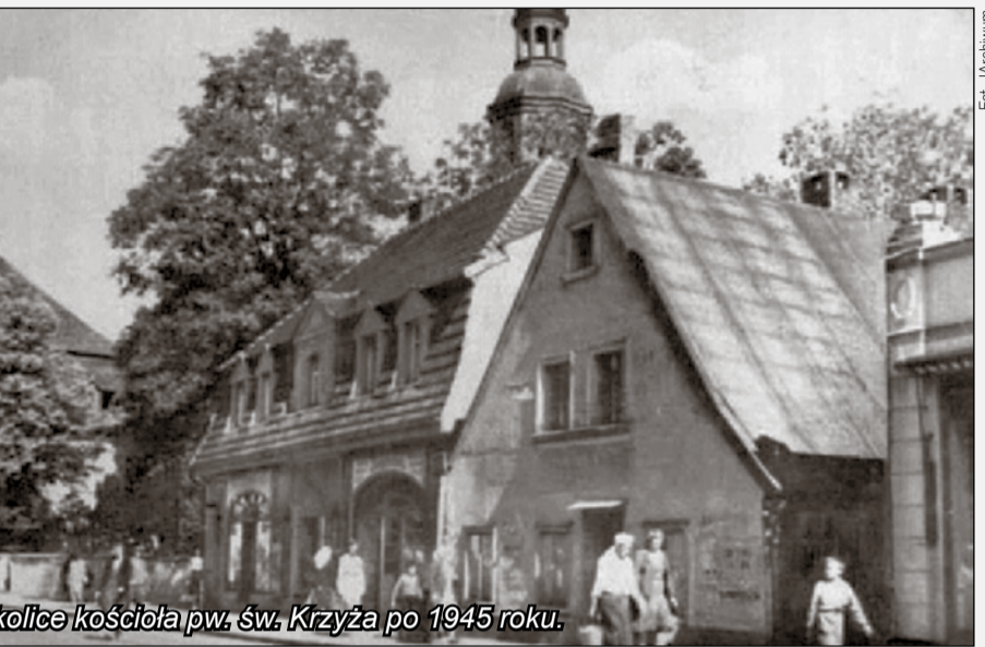
Okolice kościoła pw. św. Krzyża po 1945 roku.

Wcześniej, na rogu Okrzei i Kolejowej, ma piekarnię, gdzie serwuje słodkawe chlebki sułtańskie z rodzynkami, ale przenosi biznes na