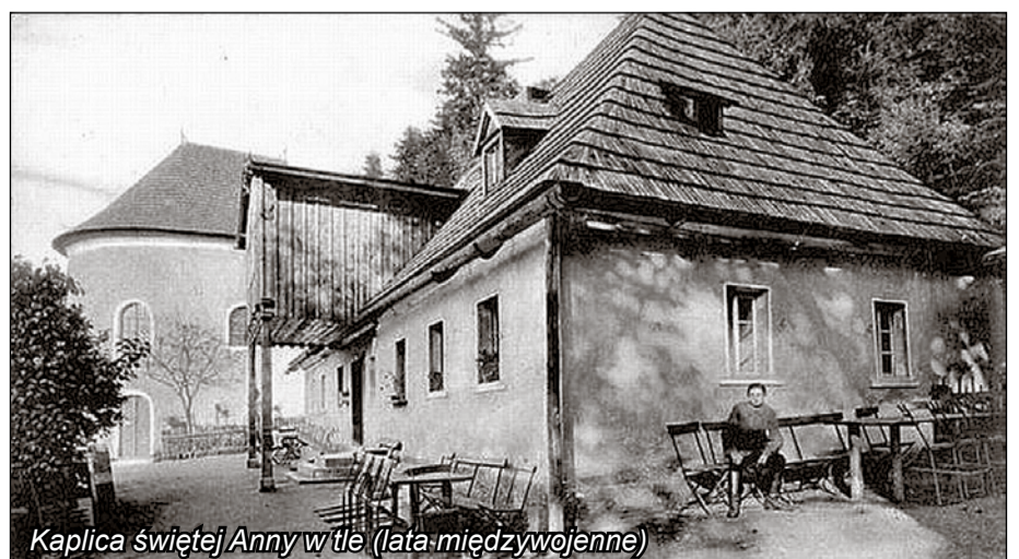
Kaplica świętej Anny w tle (lata międzywojenne)