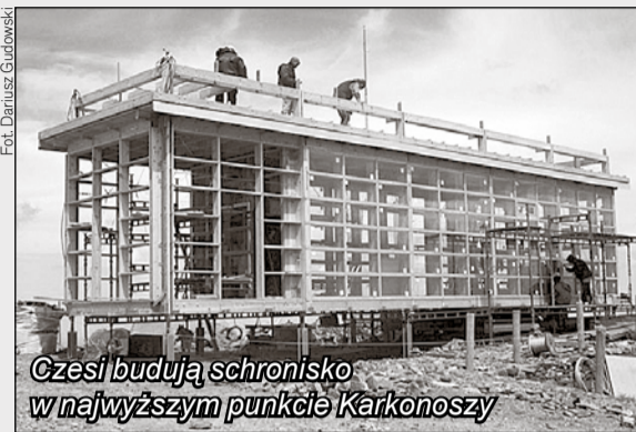
Czesi budują schronisko w najwyższym punkcie Karkonoszy

Drewniana konstrukcja, której powstawanie od jakiegoś czasu obserwują spacerujący po szczycie Śnieżki turyści, to szkielet nowego schroniska po czeskiej stronie góry.