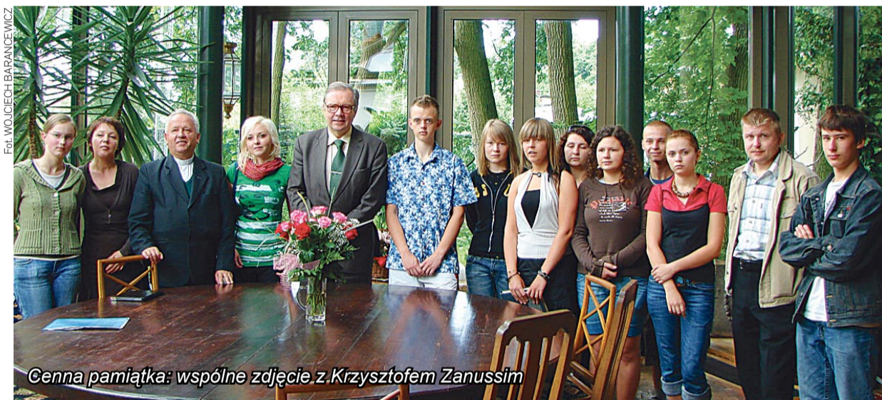
Genna pamiątka: wspólne zdjęcie z Krzysztofem Zanussim