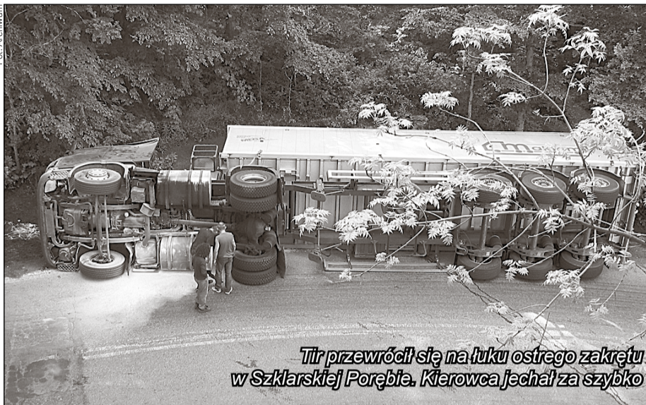
Tir przewrócił się na łuku ostrego zakrętu w Szklarskiej Porębie. Kierowca jechał za szybko

większą niż 60 km na godzinę może się skończyć urwaniem koła. Niebezpieczna jest trasa do Legnicy, przez Świerżawę. I to nie tylko z powodu zakrętów, ale i niezliczonej liczby dziur i łat. Nie ma tygodnia, by na tej drodze nie doszło do wypadku.