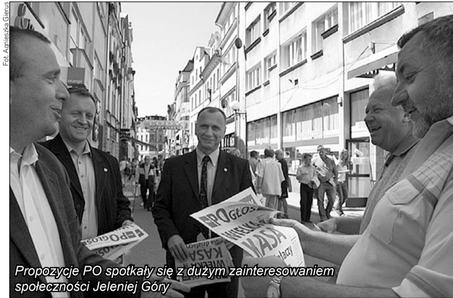
Propozycje PO spotkały się z dużym zainteresowaniem społeczności Jeleniej Góry

W związku z doniesieniami o przedterminowych wyborach parlamentarnych do boju o wyborców, nie zważając na sezon ogórkowy, ruszyli politycy PO.