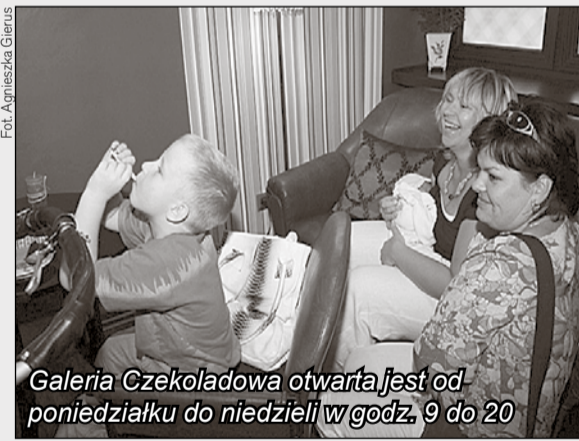
Galeria Czekoladowa otwarta jest od poniedziałku do niedzieli w godz. 9 do 20